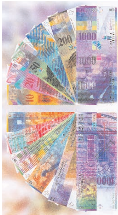
Hoher Sicherheitsstandard: Wer findet all die verschiedenen Zahlen?

Banknoten: Drucktechnologie der Spitzenklasse