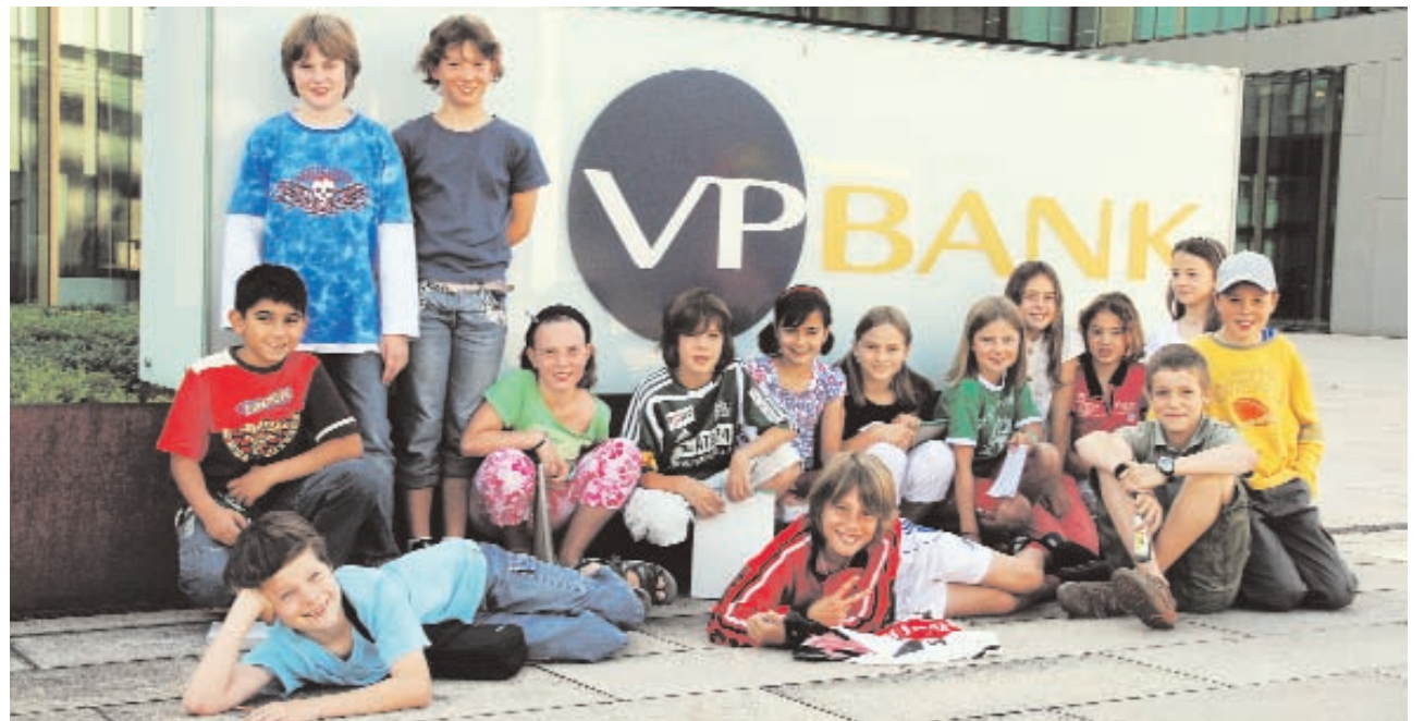
Ein Blick auch hinter die Kulissen: Die 4. Klasse Sax freut sich auf den Besuch bei der VP Bank in Vaduz.

Die Auszubildenden der VP Bank arbeiten in Teams in einer Lernwerkstatt zusammen. Sie haben eigene Kunden, leiten Projekte, organisieren Schnuppertage und haben Mitspracherecht. «Unser» Team mit Lehrmeister be-