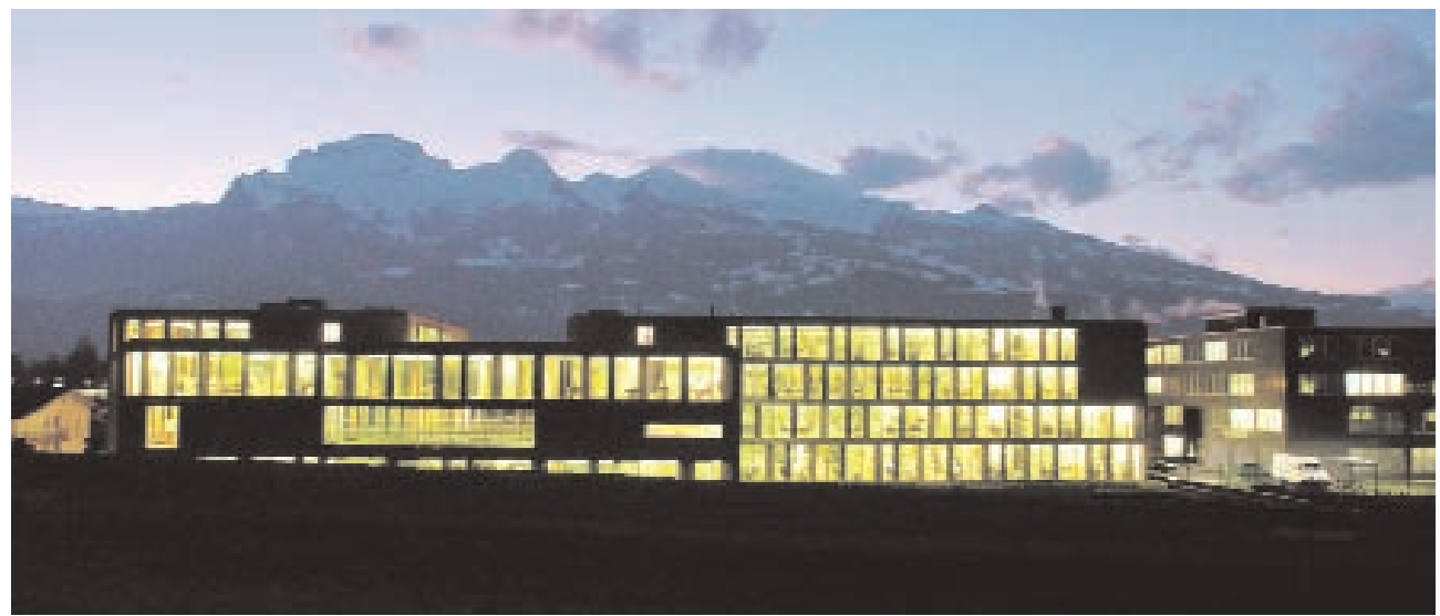
Arbeitsplatz für unterschiedlichste Berufe: Teilweise wird auf der VP Bank auch in der Nacht gearbeitet.